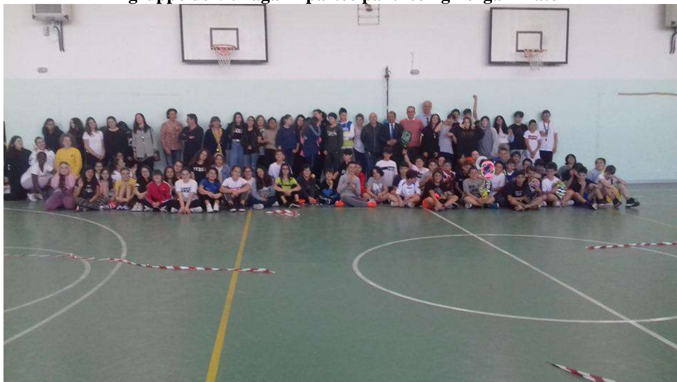
TORNEO SCUOLE MEDIE IC3 CERVIA Il gruppo dei premiati